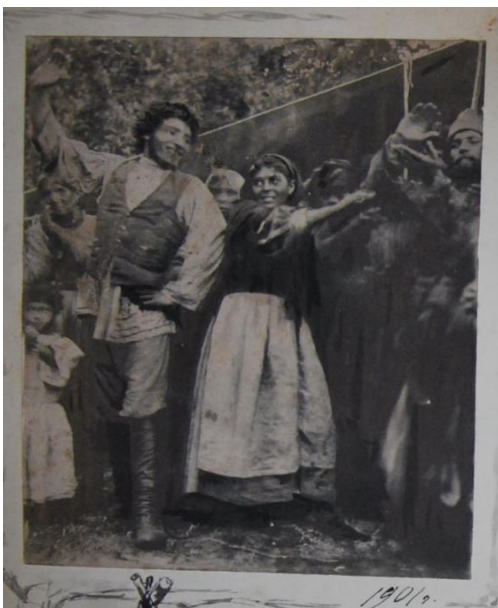
Цыганский табор в окрестностях Шушар