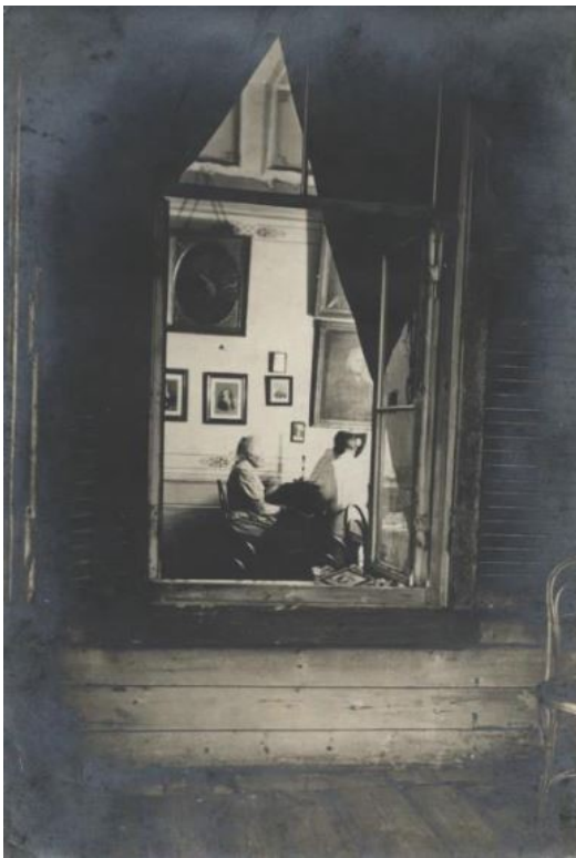
Зал в доме Боратынских в имении Шушары, 1900-е.