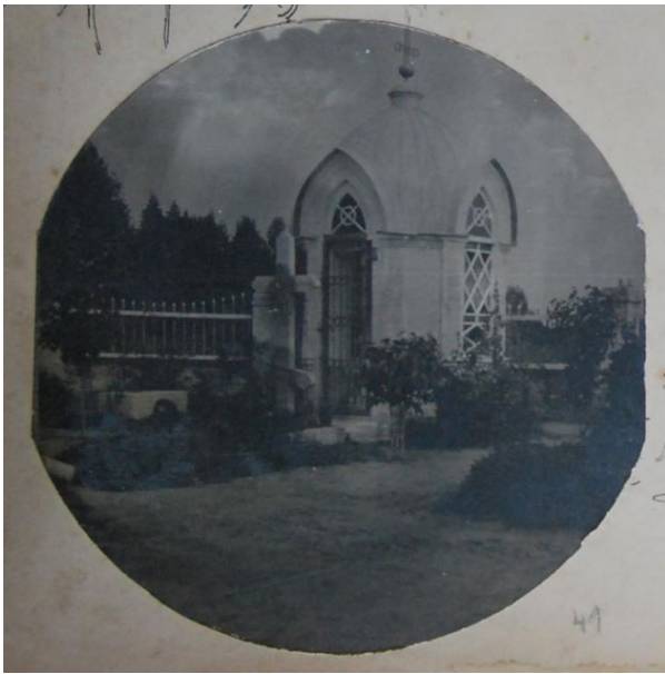
Часовня-усыпальница над могилой Н.Е. Боратынского 1899 г.