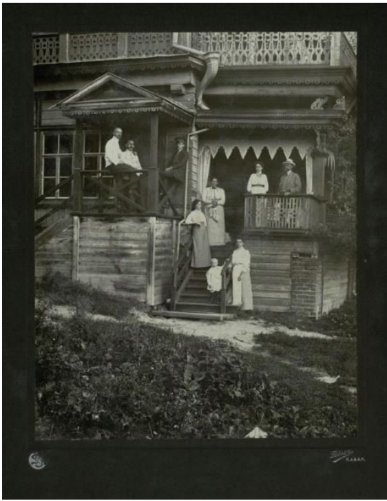
Альбом летнего быта богатой дворянской семьи в Каймарах, 1911 г.