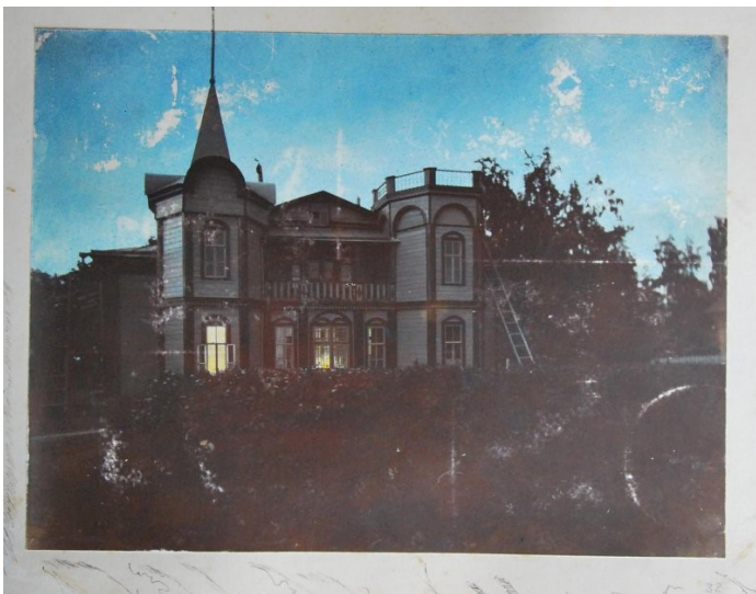
Дом в Шушарах