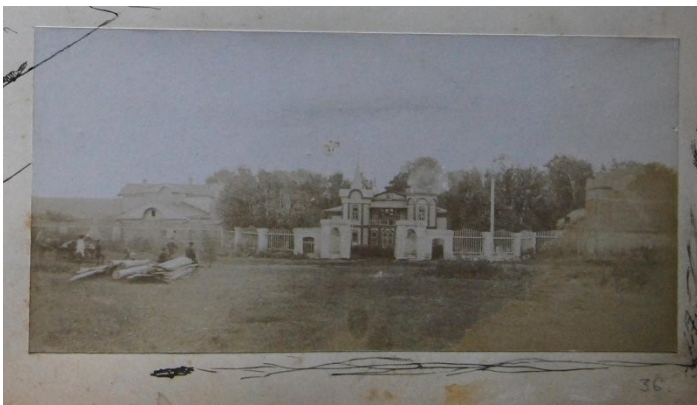
Усадьба в Шушарах