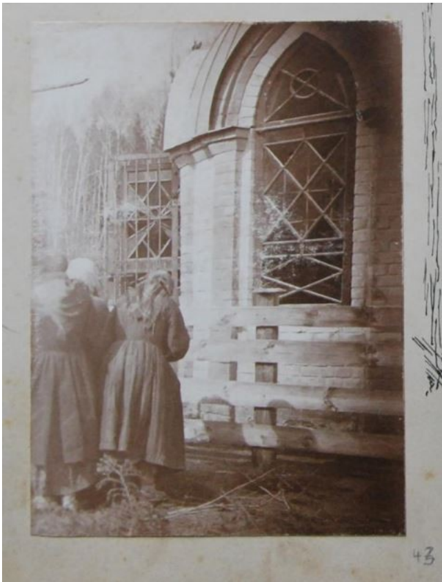
У часовни Н.Е. Боратынского Следующая фотография не из альбома, но на ней тоже Боратынские.