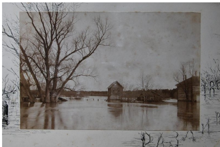
Окрестности Шушар 1899 г

37 фотографий, сделанных вблизи усадьбы Шушары Собакинской волости Казанского уезда Казанской губернии.